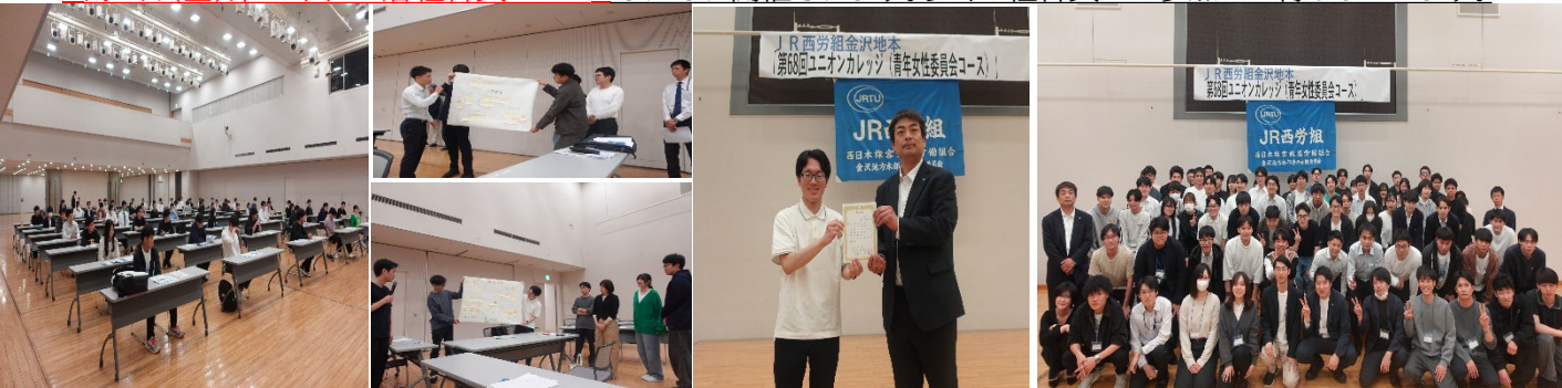
講義受講の様子 グループ討議の発表 修了書授与 多くのご参加ありがとうございました。

6月11日(木)第2回ユニオンスクール(社会人採用コース)、6月19日(金)第6回分会三役コース 7月3日(金)第26回ML層組合員コース それぞれ開催されます。多くの組合員のご参加をお待ちしています。