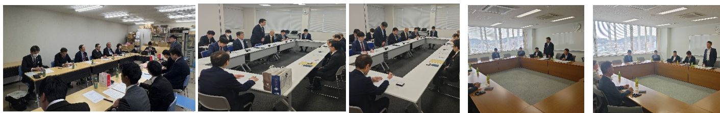
IRいしかわ鉄道株式会社との労使意見交換 あいの風とやま鉄道株式会社との労使意見交換 株式会社ハピラインふくいの労使意見交換

意見交換では、各社における課題(設備、手当、勤務、プロパー社員の養成状況、出向者の意向や意見等)を相互に共有できました。今後も労使で建設的な意見交換を続け、出向され活躍する組合員の不安解消に努めていきます。