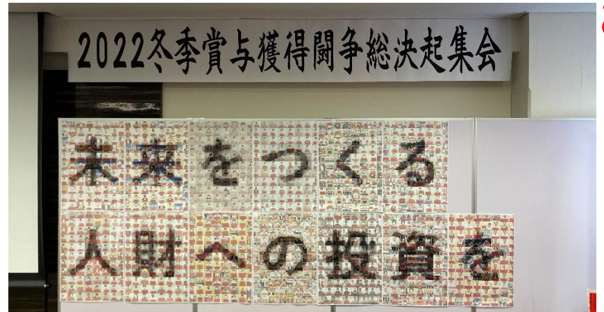
組合員の思いが込められたフォトモザイクも会場に飾られた