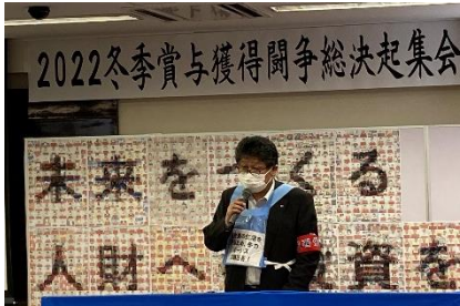
中央本部 本田副委員長