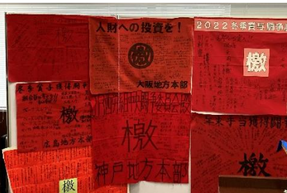
会場には組合員の思い詰まった 檄布が会場に掲げられた