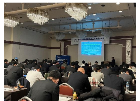
提言の説明を受ける参加者