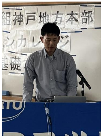
国鉄改革と民主的労働運動 について説明を行う 岡教育部長