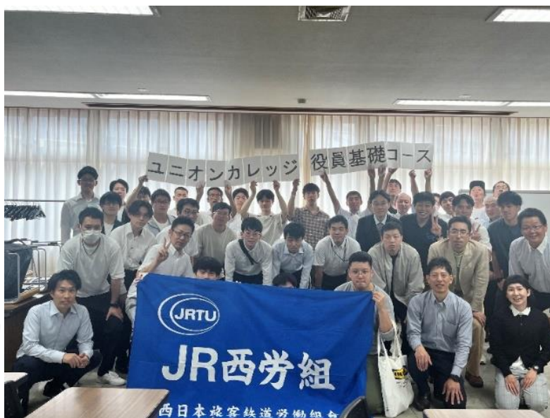
次世代のリーダーとして 期待される受講生たち

その後、世話役活動で困っていることをテーマにグループディスカッションを行い、最後に、全ての講義やグループディスカッションを受け、今後どのように取り組んでいくのか受講生一人一人が力強い決意表明を行い、ユニオンカレッジは終了した。