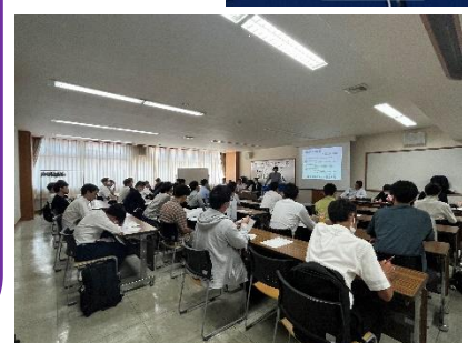
各種講義を受ける 受講生たち