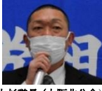
大杉議長（大阪北分会）