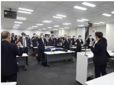
総団結でガンパロー！